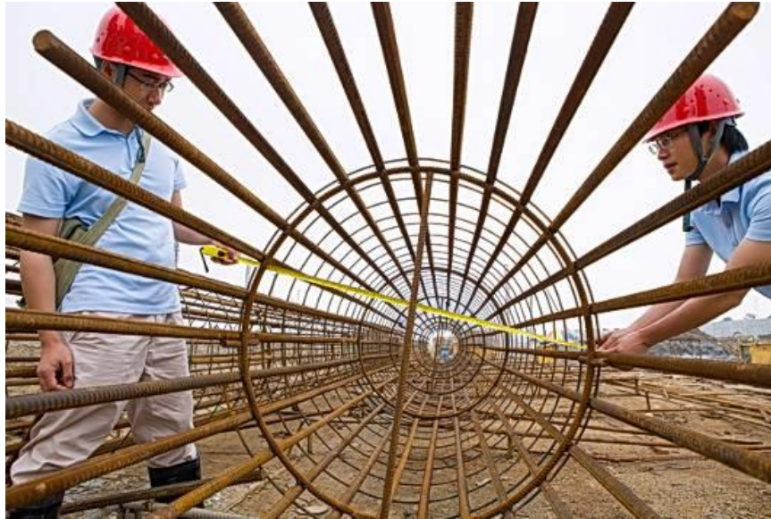
工程管理的精细把控