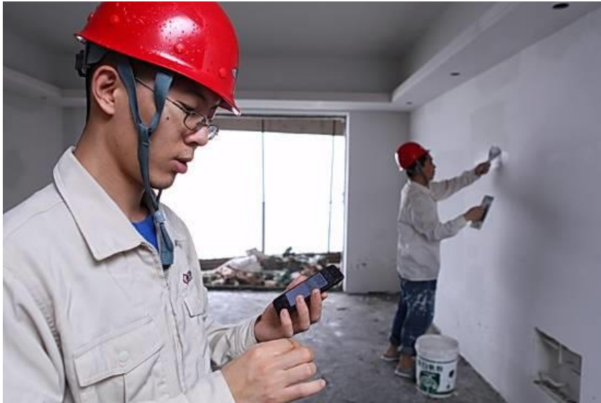
工作人员通过自主研发的项目软件对工程进行实时监控

2013年上半年，公司通过技术创新和软件开发，开创移动终端应用于工程现场管理的新尝试，实现工程项目现场管理工作与信息收集工作同步，极大地提高了信息的及时性及管理的有效性。