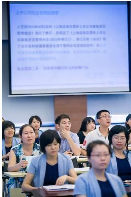
员工专业知识培训