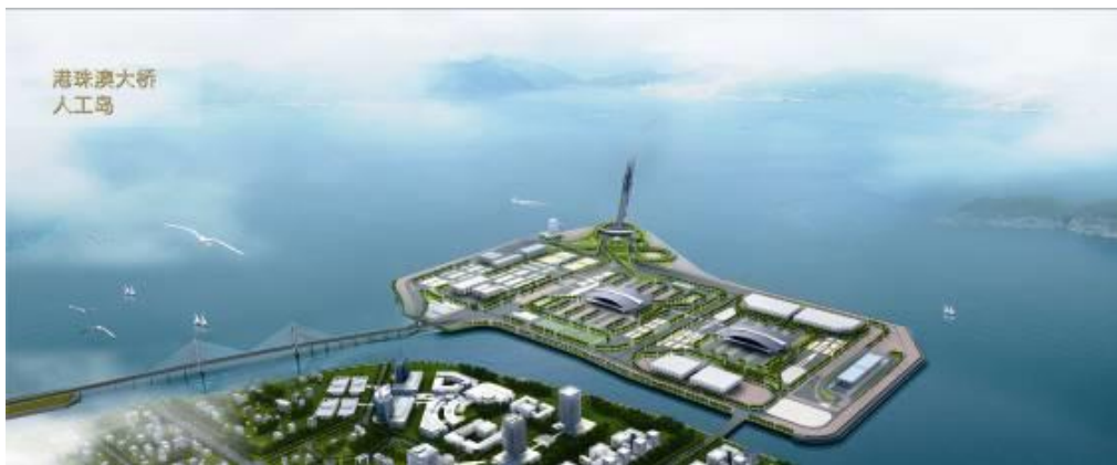
港珠澳大桥人工岛效果图

在“蓝色珠海、科学崛起”发展战略的带动下，公司勇于承担企业公民责任，包括港珠澳大桥人工岛填海工程、港珠澳大桥珠海口岸、洪湾中心渔港开发、香洲港区域综合工程整治等工程项目的建设，并引入精细化管理，以高质量、高标准来促进各项目的开发建设。