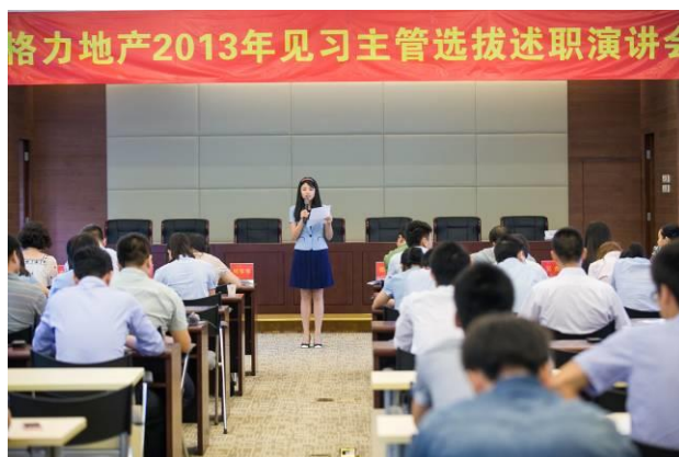
见习主管选拔述职演讲会

由公司多位中高层领导亲自担任导师,对数十名来自各部门和各业务公司的核心人才培养对象实施“一对一”的定向指导,帮助年轻骨干提升专业能力和综合素质,为公司后续发展储备人才。