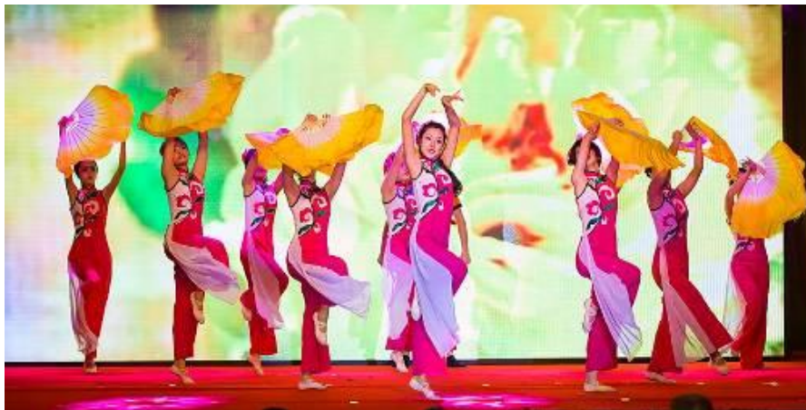
丰富多彩的员工生活