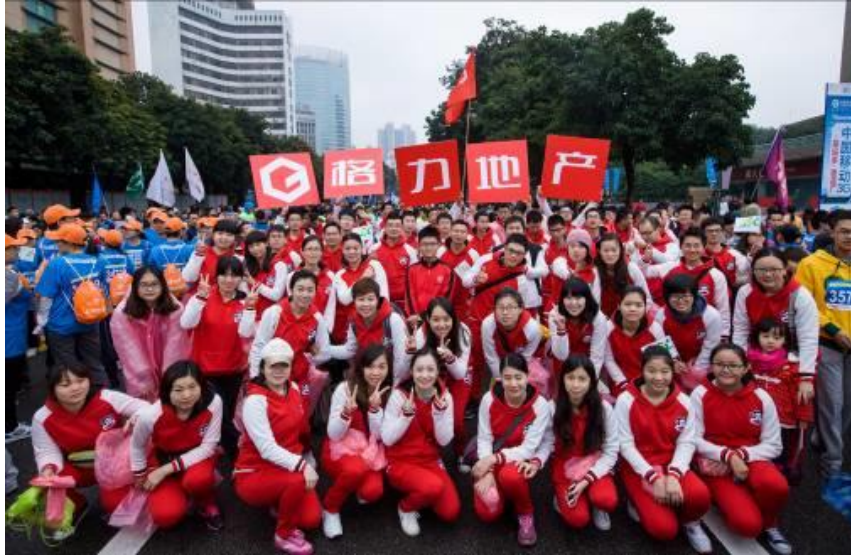
格力地产方队参加珠海半程马拉松比赛