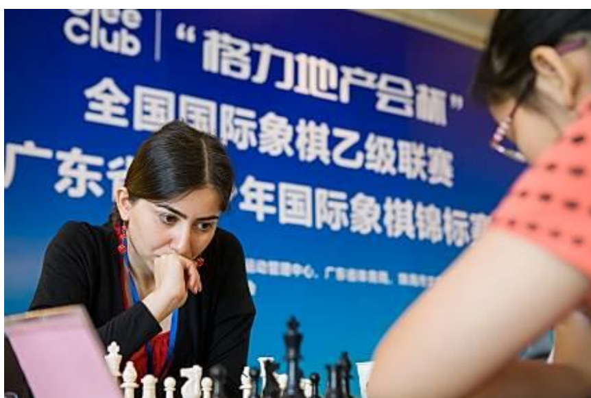
“格力地产会杯”全国国际象棋乙级联赛