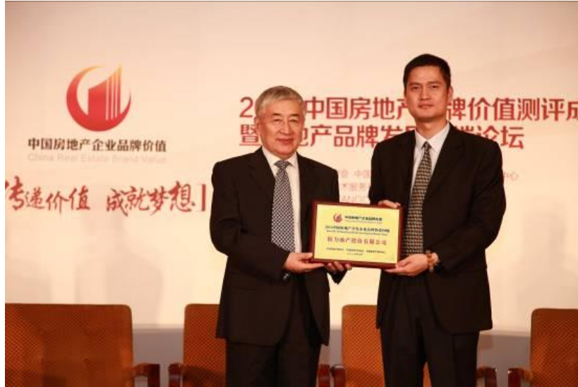
格力地产荣获“2013 中国房地产开发企业品牌价值 50 强”