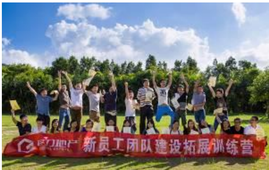
新员工团队建设拓展训练营

格力地产邀请益策培训公司讲师来公司对中层干部讲授《部署培育与发展》课程，同时组织员工参加德鲁克管理学院的版权课程《卓有成效管理者》。内外培训课程得到受训学员的一致认可。