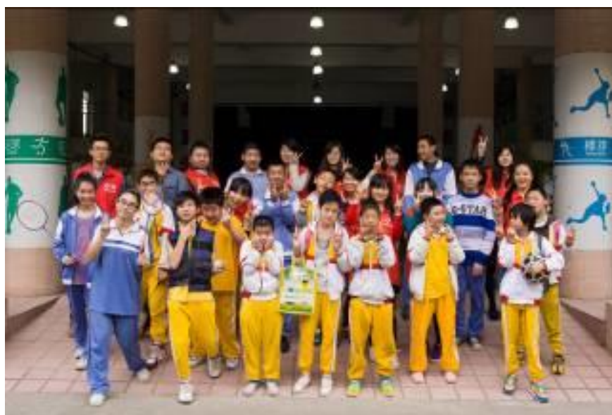
志愿者与特殊学校的孩子们合影

自 2013 年 9 月起，格力地产开展“温暖身边的他 关爱特殊儿童”一对一帮扶体验志愿服务活动，与特殊儿童建立长期互动、沟通的渠道。