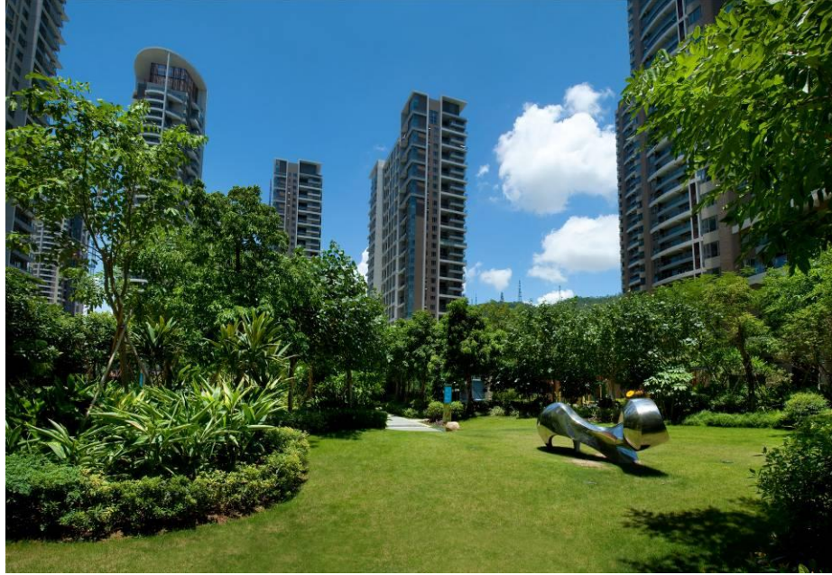
格力广场项目荣获“广东省绿色住区金奖”