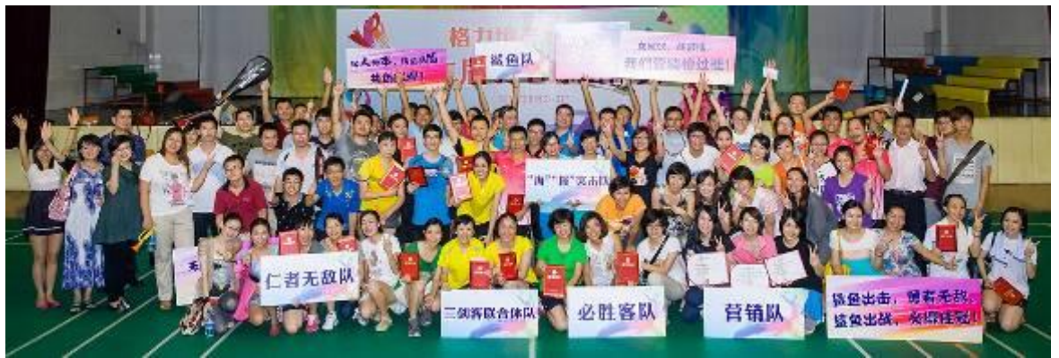
2013 年度格力地产员工羽毛球比赛