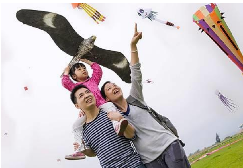
珠海首次国际风筝节

2013年，公司先后赞助和承办了“广东省青少年国际象棋锦标赛”、“全国国际象棋乙级联赛”、“珠海首次国际风筝节”、“快乐骑行、浪漫珠海”绿色公益千人骑行活动、“跨界——交响乐与弗拉门哥”新年音乐会等活动，还组队参与“珠海半程马拉松赛”等多项文体活动，为城市的体育事业及社会文化建设做出了积极的贡献。