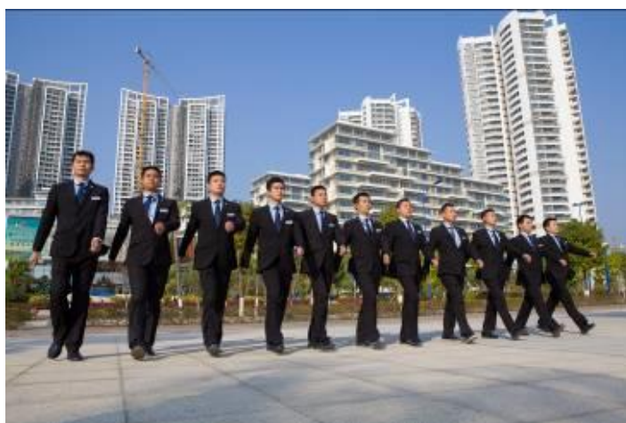
训练有素的保安队伍