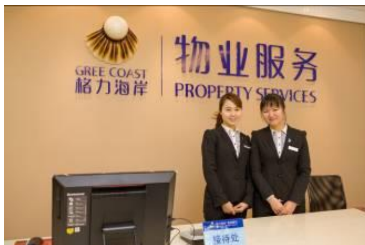
主动热情的管理人员