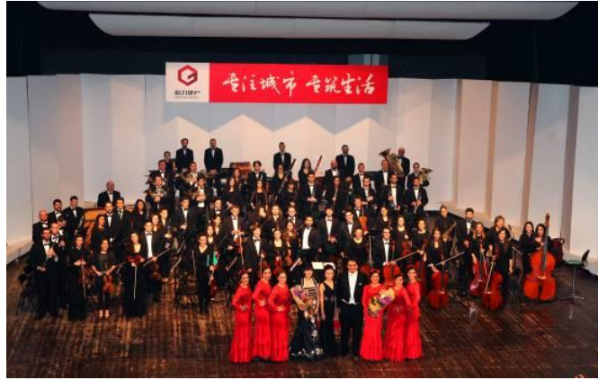
“跨界——交响乐与弗拉门哥”新年音乐会