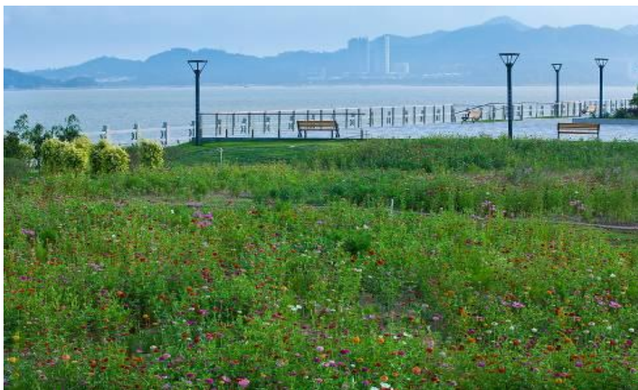
改造后的滨海公园生机盎然

格力地产积极响应珠海政府“蓝色珠海，科学崛起”的发展战略。2011年，公司承建占地面积约17.5万m 2 的格力海岸滨海公园；2013年，公司又斥资对滨海公园进行改造升级，努力将其打造成为集娱乐休闲、特色花海艺术、有氧运动、观海、观景功能于一体的城市滨海公园。