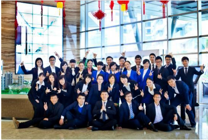
格力海岸销售团队