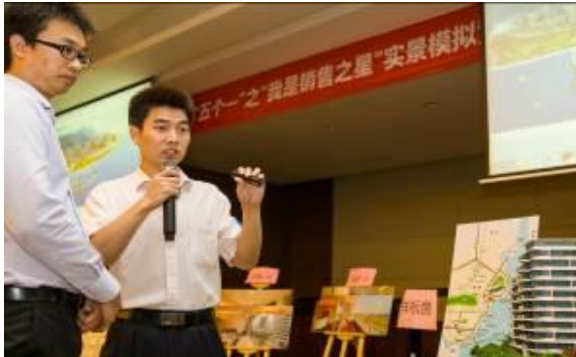
“我是销售之星”风采大赛