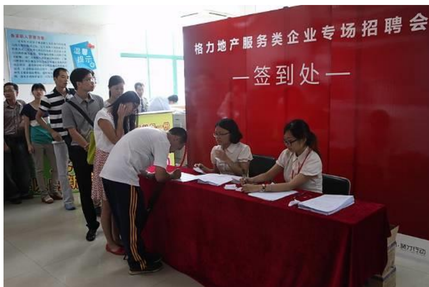
格力地产专场招聘会

近几年公司通过校园招聘、社会专场招聘，吸纳了一大批专业人才和精英，保障了公司的持续健康发展，缓解了社会就业压力。据统计，2013年，格力地产共计新入职员工247人。