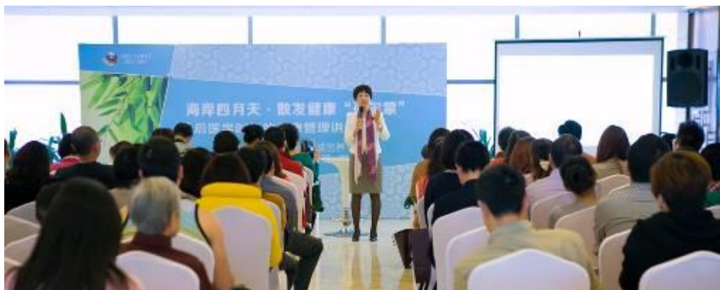
邀请养生专家为市民做健康讲座

2013年，格力地产曾邀请多位养生、家具、美食等领域的专家学者到珠海讲学，丰富了广大市民的精神文化生活。