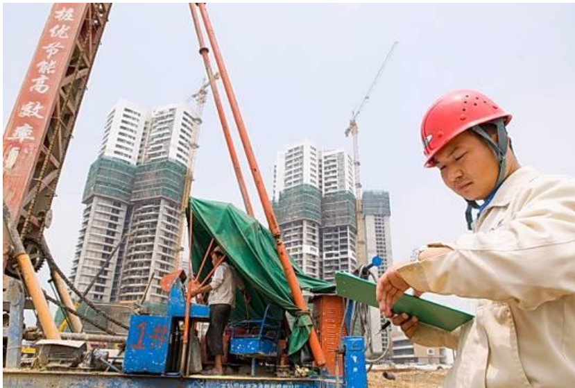
格力海岸项目工作人员进行现场监管

格力地产坚持“精品战略”，在产品打造和项目管理过程中，全程细化、标准化，对于规划、设计、施工、建造等各个环节形成管理链条，全面保障工程的施工质量。