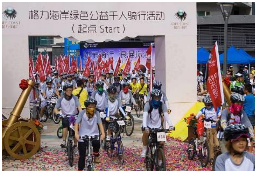
绿色公益千人骑行活动