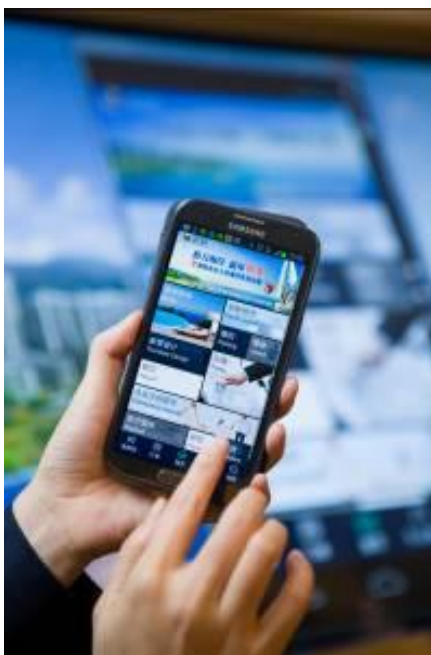
格力海岸业主通过专属 APP 系统享受物业便捷服务