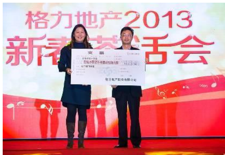
2013 新春茶话会上的“迎新春义卖活动”

公司组织员工开展了“迎新春义卖活动”，共筹集义卖款项 107876 元，全部捐赠给珠海市红十字会。