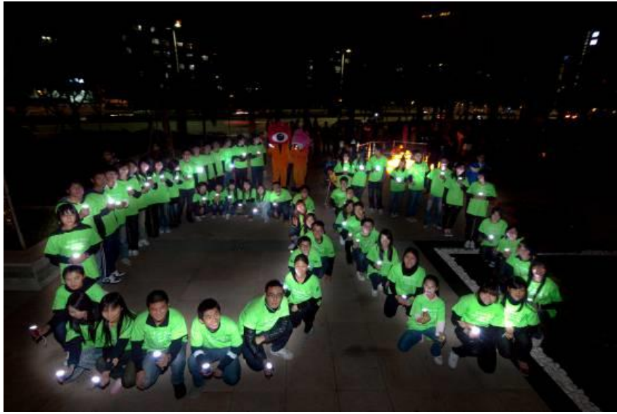
格力地产“地球一小时”活动